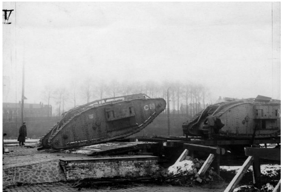
Dezember 1917

Le 8 décembre 17, les allemands ont exhibé un tank au Carré de Paille. Les tanks récupérés sont envoyés par train jusqu'à Charleroi où ils sont réparés. Marqués de la croix de Malte, ils seront utilisés contre les Alliés.