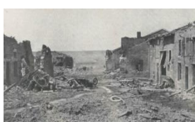
Village de Fleury-devant-Douaumont