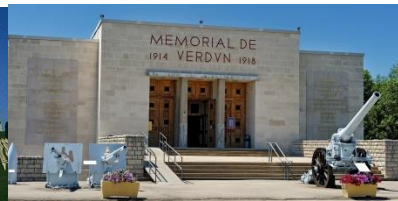
Mémorial de Verdun