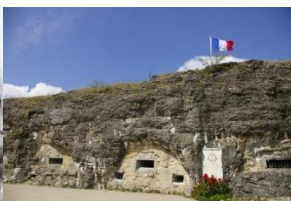
Fort de Douaumont