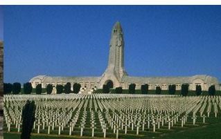
Ossuaire de Douaumont